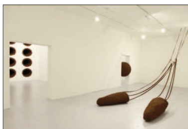
CAROLINE LE MÉHAUTÉ Cocotrope [2011] Vue d'ensemble de l'exposition Galerie Château de Servières, Marseille