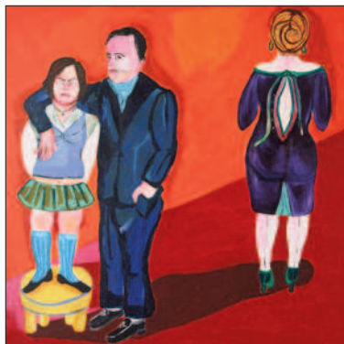
SARA MAIA A boa filha (la bonne fille) [2007] acrylique sur toile [200 x 200 cm]

Les structures adhérentes de Marseille expos font leur rentrée de l'art contemporain. En s'associant à art-o-rama elles ont concocté une reprise détonante avec une programmation de haut vol.